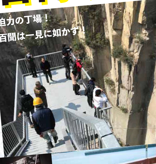
迫力の丁場！ 百間は一見に如かず！