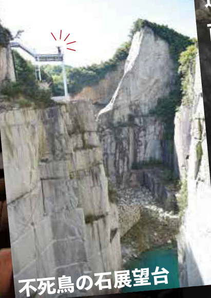
不死鳥の石展望台