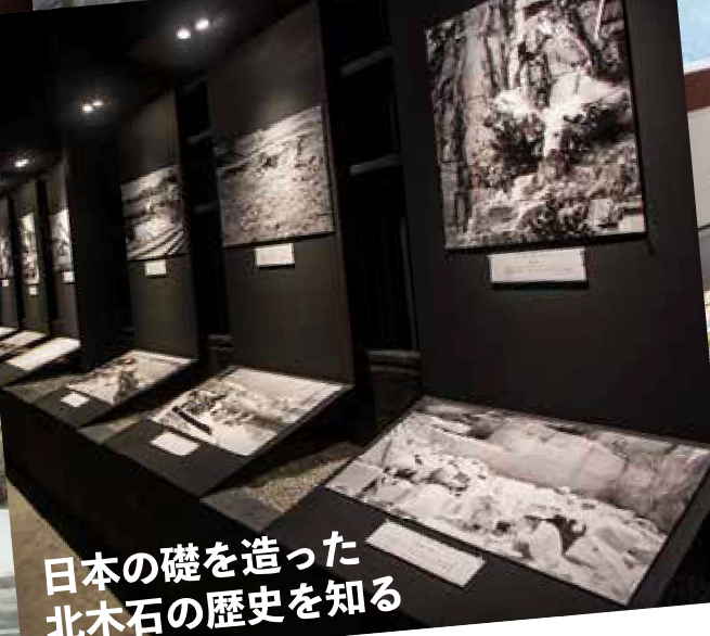
日本の礎を造った 北木石の歴史を知る