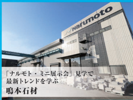
「ナルモト・ミニ展示会」見学で 最新トレンドを学ぶ 鳴本石材