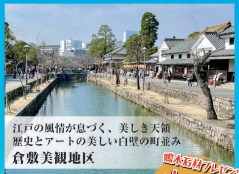
江戸の風情が息づく、美しき天領 歴史とアート美しい白壁の町並み 倉敷美観地区