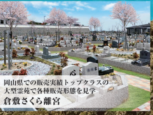
岡山県での販売実績トップクラスの 大型霊苑で各種販売形態を見学 倉敷さくら離宮