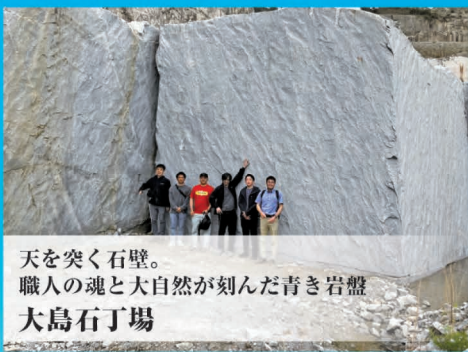
天を突く石壁。 職人の魂と大自然が刻んだ青き岩盤 大島石丁場